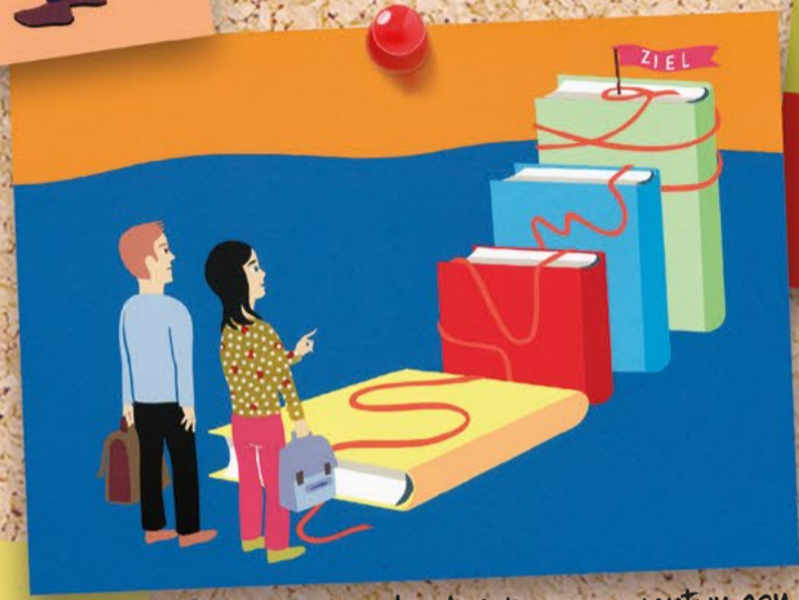
Transparenz der Leistungserwartungen