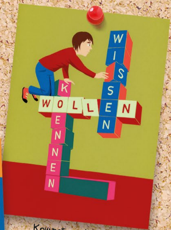
Kompetenz: Wissen, Können und Wollen