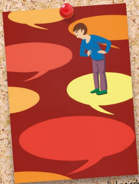
Standortbestimmungen, dialogische Leistungsrückmeldungen