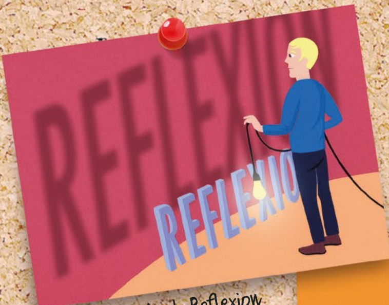
Erkenntnisse durch Reflexion