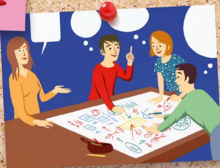
Instruktion, Konstruktion, Interaktion